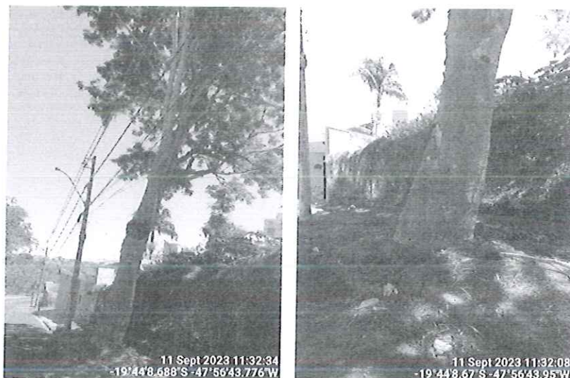
Figura 1 – Farinha-seca.

Considerando os comprometimentos existentes, encaminhamos a autorização para supressão e destoca para a Secretaria de Serviços Urbanos e Obras para conhecimento e execução.